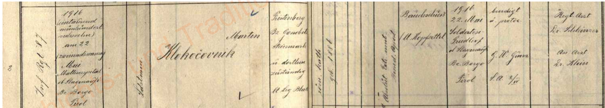
Abbildung Beispiel Matrikel-Original

Man beachte, wie viele VL-Verwundetenmeldungen nicht durch (zweite) Todesmeldungen ergänzt wurden.